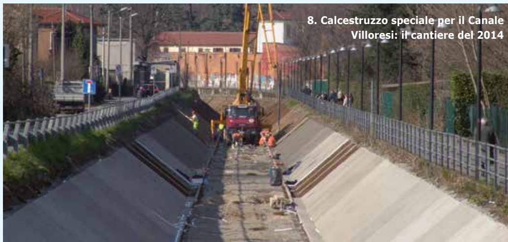
8. Calcestruzzo speciale per il Canale Villoresi: il cantiere del 2014

dall'insieme di tutte le prestazioni ottenute in piena sinergia, grazie alla ricerca, allo sviluppo e, soprattutto, alle idee. L'Aeternum è un formulato straordinario, dai dosaggi contenuti e da prezzi più che supportabili se li confrontiamo, con la somma delle singole prestazioni. Da 15 anni impieghiamo l'Aeternum per realizzare la pavimentazione della nostra consociata Tensofloor, oltre 1,5 milioni di m 2 di pavimenti in postensione coperti da una polizza decennale mai, ripeto mai attivata. In 15 anni abbiamo costruito pavimenti industriali senza alcuna contestazione, con resistenze meccaniche raddoppiate, totalmente impermeabili, a penetrazione zero, resistenti all'aggressione di detersivi e sali antighiaccio negli esterni. Il calcestruzzo con Aeternum - Aeternum CAL - è stato poi impiegato con successo anche nelle infrastrutture, nelle riqualificazioni, nei ripristini. Un caso da manuale è stato il rifacimento di fondo e sponde di uno dei