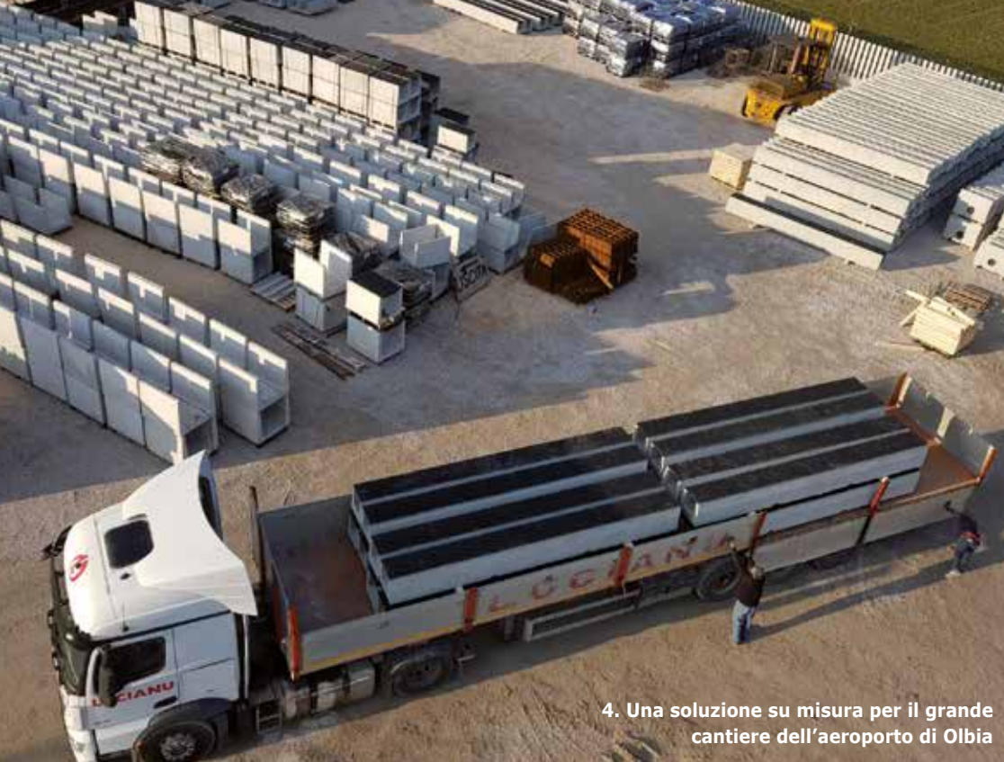
4. Una soluzione su misura per il grande cantiere dell'aeroporto di Olbia