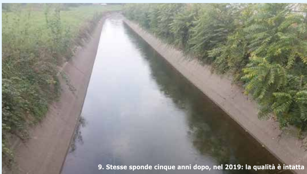
9. Stesse sponde cinque anni dopo, nel 2019: la qualità è intatta