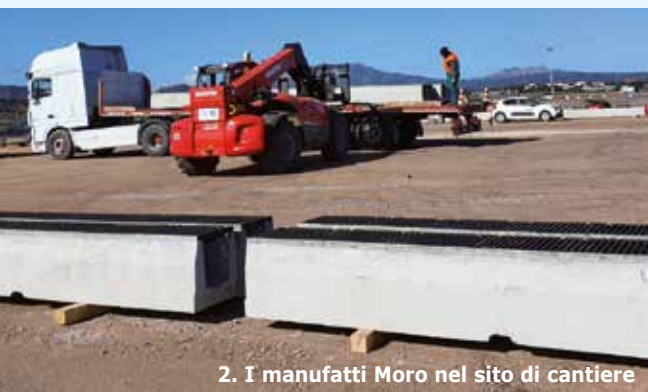
2. I manufatti Moro nel sito di cantiere

Quarant'anni tondi, vissuti sotto il segno della qualità. Moro ( fratellimoro.com ), sede a Silea (Trevi- so), è un'azienda che l'eccellenza produttiva - nel campo dei manufatti cementizi - la ricerca, la propone, la mette in opera; con risultati che non possono che portare alla soddisfazione di tutta la filiera coinvolta nel processo costruttivo. È andata così, in tempi recenti, in un cantiere noto ai lettori di leStrade , raccontato proprio nello scorso numero di maggio nell'intervista all'ingegner Pasquino Stati, responsabile dei lavori per Pavimental (si veda "Prova riuscita d'orchestra", sezione Macchine): la grande riqualificazione dell'aeroporto di Olbia, una best practice sia sul piano esecutivo, sia su quello dell'organizzazione generale (trasporti, logistica e via dicendo). I canali e i pozzetti in calcestruzzo che sono andati a comporre il sistema di regimazione delle acque realizzato ex novo sono stati prodotti proprio da Moro, che ha impiegato per nell'impasto cementizio ad alta durabilità e lavorabilità (ne parliamo a fondo nel secondo focus) il compound Aeternum, sviluppato dall'Istituto Italiano per il Calcestruzzo.