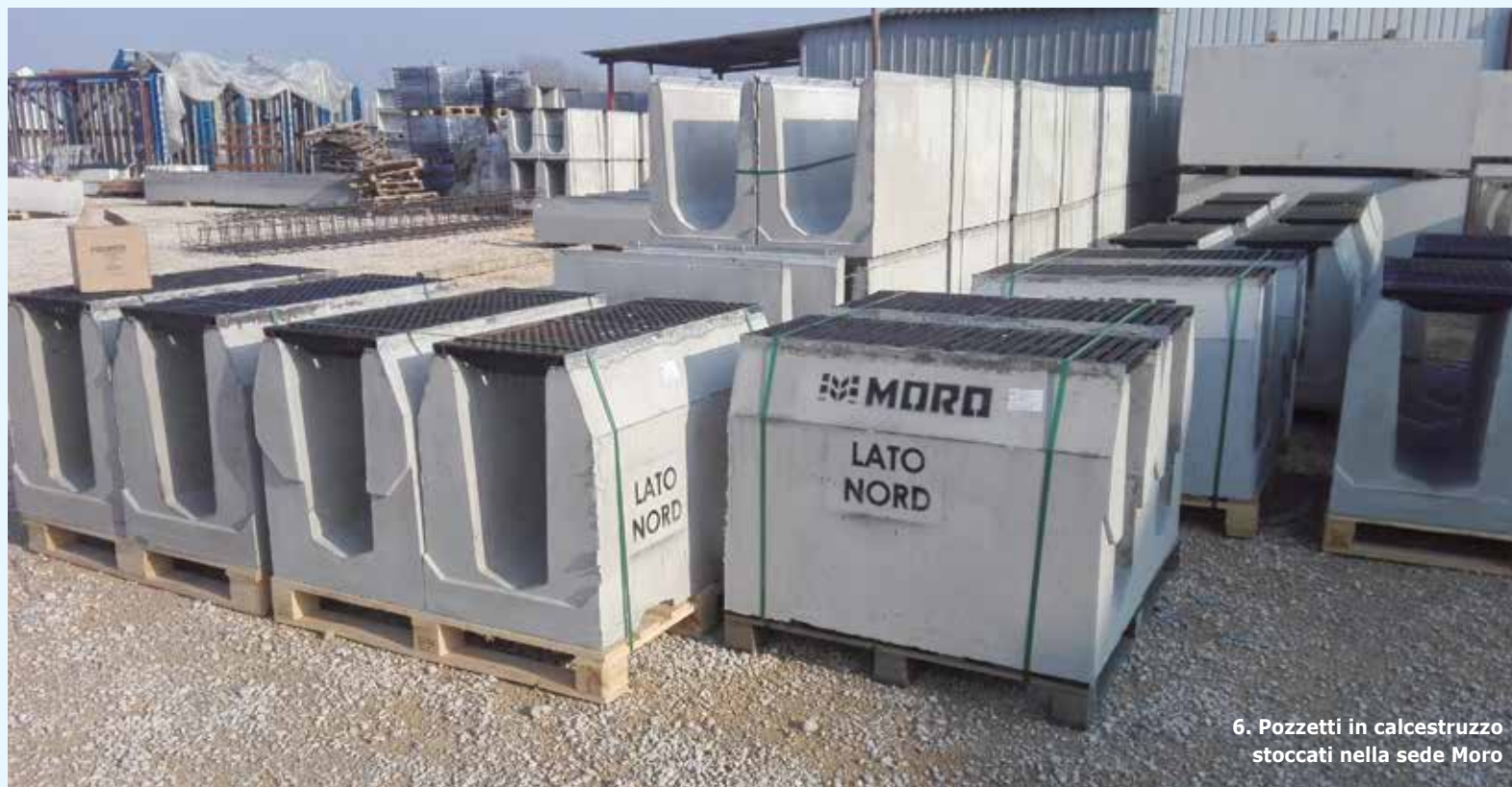
6. Pozzetti in calcestruzzo stoccati nella sede Moro

sul fronte dei materiali, alla copertura in ghisa sferoidale classe F900, anche qui della massima qualità, quella richiesta in ambito aeroportuale, da sempre una grande palestra di innovazione e rigore tecnico. Da Moro lo sanno bene, perché il trasferimento interno di know how è patrimonio aziendale e ne beneficiano tutte le soluzioni prodotte per il settore delle infrastrutture, dalle reti Anas come la E45 a quelle del network autostradale come la Terza Corsia dell'A4 Venezia-Trieste, soltanto due esempi di interventi un cui l'azienda veneta è attualmente impegnata. ■■