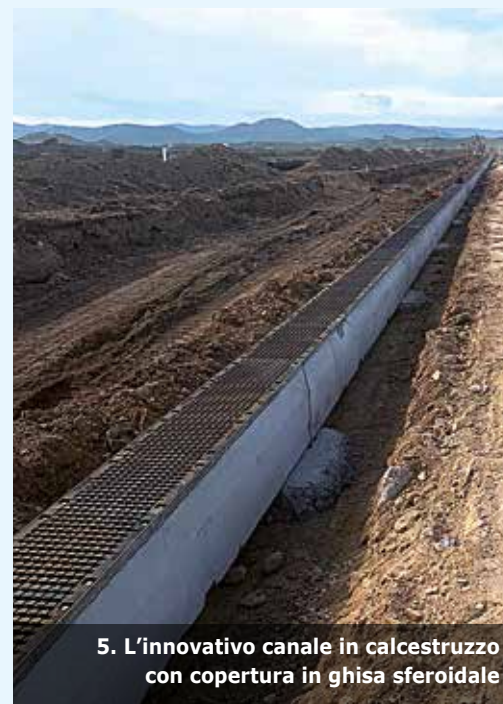
5. L'innovativo canale in calcestruzzo con copertura in ghisa sferoidale