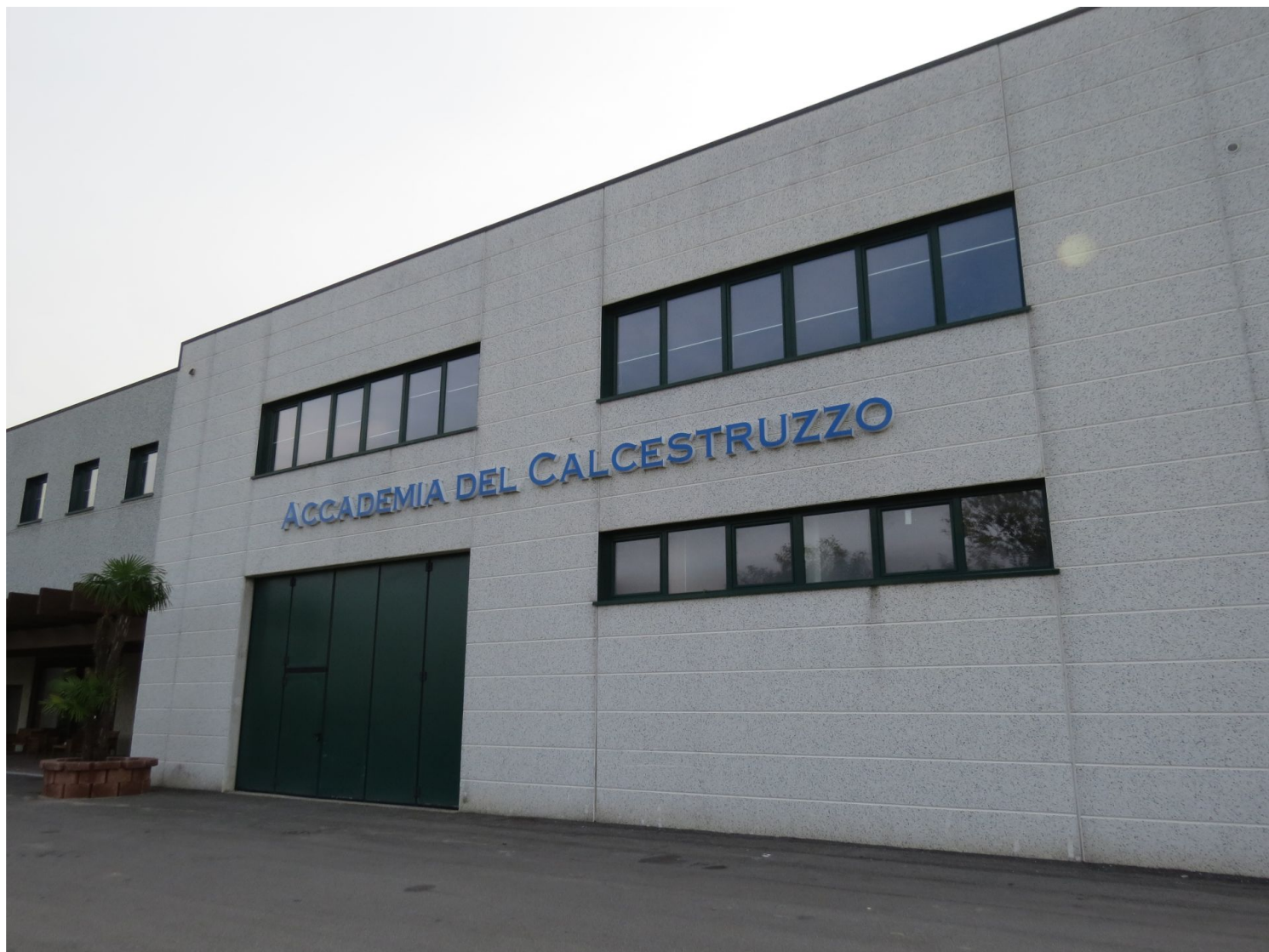
L'Accademia del Calcestruzzo di Renate (Monza Brianza)