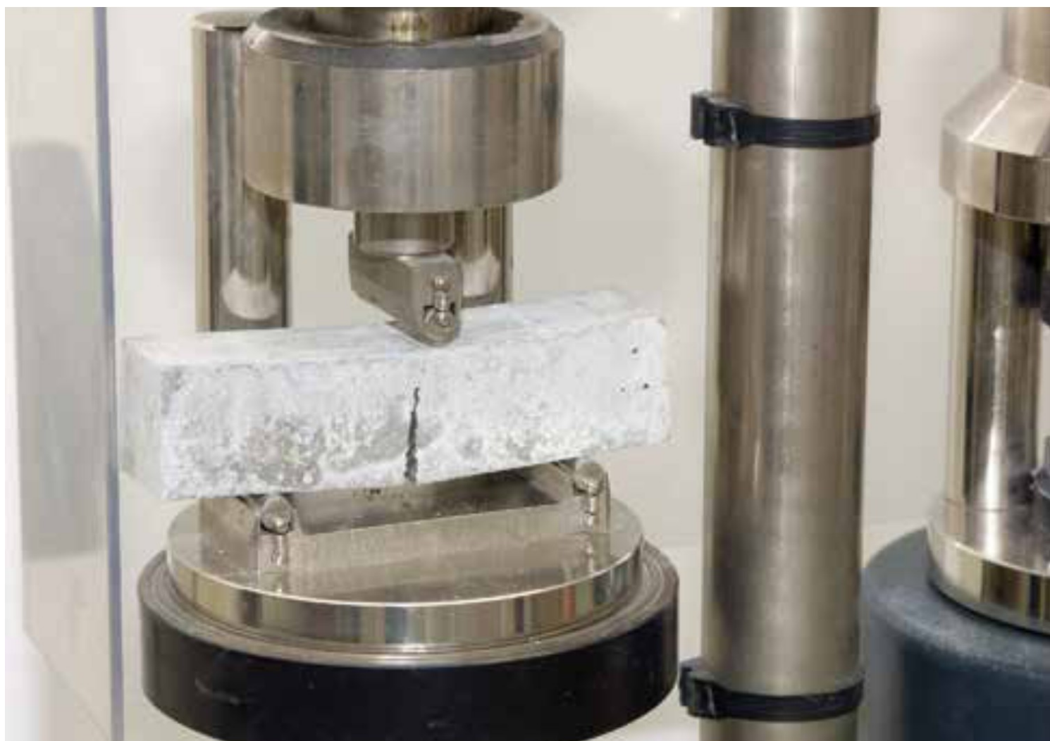
Aeternum HTE: Prova di flesso-trazione in corso

Una soluzione efficace a queste problematiche offerta dalla tecnica attuale può essere considerata il microcalcestruzzo micro-armato Microbeton HTE, particolarmente durabile, praticamente impermeabile all'acqua e all'aria e prestante sia rispetto alle sollecitazioni normali di compressione e di trazione, sia rispetto alle sollecitazioni tangenziali di interfaccia, quale l'adesione all'acciaio di nuovo impianto e l'adesione ai vecchi supporti di c.a. di strutture preesistenti.