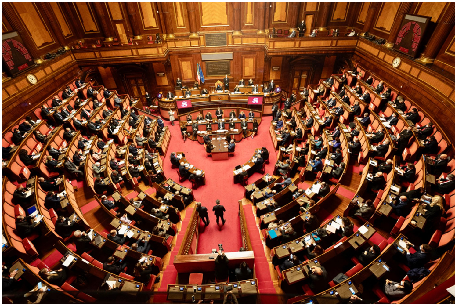
L'aula del Senato il 13 febbraio scorso

Il neo Presidente del Consiglio, Mario Draghi, nel suo discorso sulle linee programmatiche al Senato del 17 febbraio scorso, prime parole profuse dopo quelle dell'accettazione dell'incarico (con riserva), ha ricordato quantomeno tre aspetti - di interesse per questa rivista e per questa rubrica - che da molto, moltissimo, troppo tempo non echeggiavano in quell'aula tanto nobile e austera, così come in ogni altro edificio, del resto, della conurbazione parlamentare.